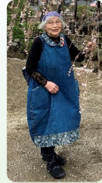
※写真は手づくり作品のイメージです。

NPO法人流山ひろがる和が、昨年未開催し沢山の方にお楽しみいただいた手づくり市Part2を、「懐石・手打ちそば あずみ野」の庭園にて、企画しました。会員が、古布をリメイクした手づくり品や生活雑貨、そして、新鮮野菜や果物を販売する手づくり作品即売会です。皆様の多数のご来場をお待ちしています。