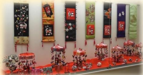
タベストリーと傘福